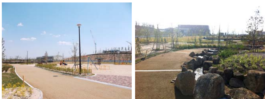
南陽中央公園がオープンしましたので、是非ご利用ください