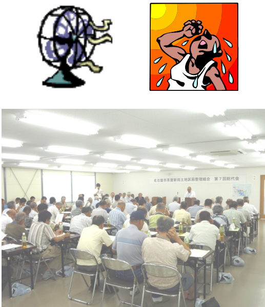
総代会 議案説明の様子

総代会にて審議された事項は、平成21年度事業報告書、収支決算書及び財産目録について並びに保留地の位置の決定及びその処分についての2つであり、いずれも原案どおり、承認、可決されました。