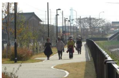
戸田川緑道を歩く参加者

それに合わせるように戸田荒子線沿いなどでは少しずつ店舗も建ちはじめ、街の姿が現れつつあります。今年も街が大きく変わっていくものと期待しております。 また、昨年の11月30日に「アクアヴェルデ・みちまちづくりの会」が主催するウォーキング大会が行われ、130名以上の方にご参加頂きました。組合として、このような賑わいづくりにも参画し、今後も街の魅力づくりに努めて参りたいと考えております。