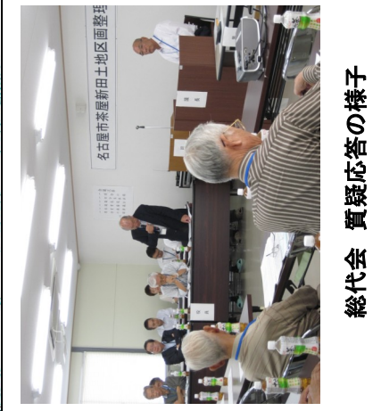
総代会 質疑応答の様子

★ 詳細な部分についてご確認されたい場合は、組合事務所又は事務局までお問い合わせください。