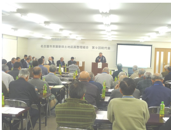
総代会 出席者の様子

十六銀行を借入先の金融機関とすることに伴い、併せて預入金金融機関に指定するもの。