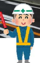
地区の骨格軸となる南秋葉線と東茶屋線が開通しました!