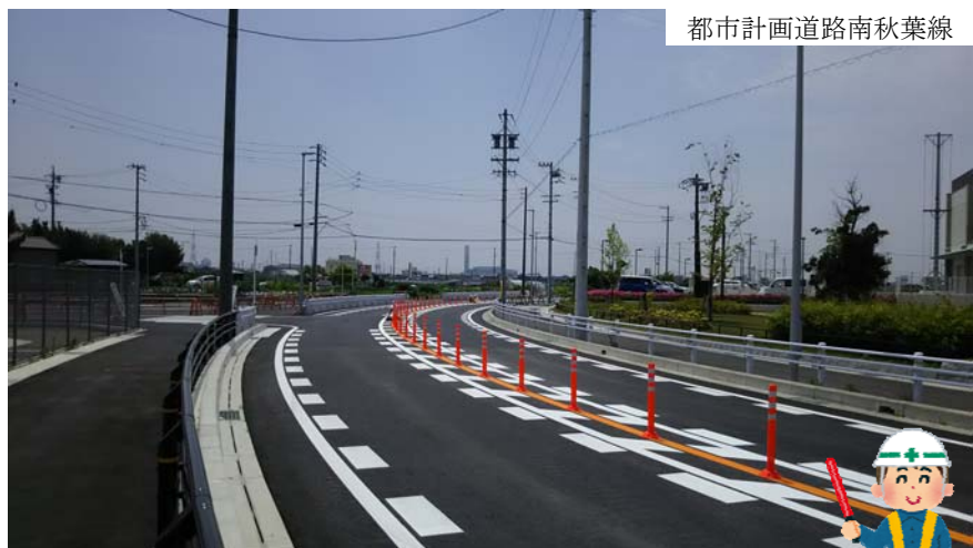
都市計画道路南秋葉線

↓ 国道302号線の直上に高速道路を建設しており、国道と高速道路の連結点が造られる予定です。完成後も、国道への出入りはこれまで通り側道から行うことになると聞いています。国道事務所には住民への周知をわかりやすく行うよう要望したいと思っております。