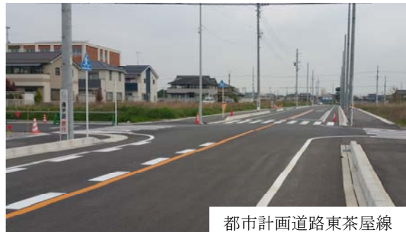
都市計画道路東茶屋線